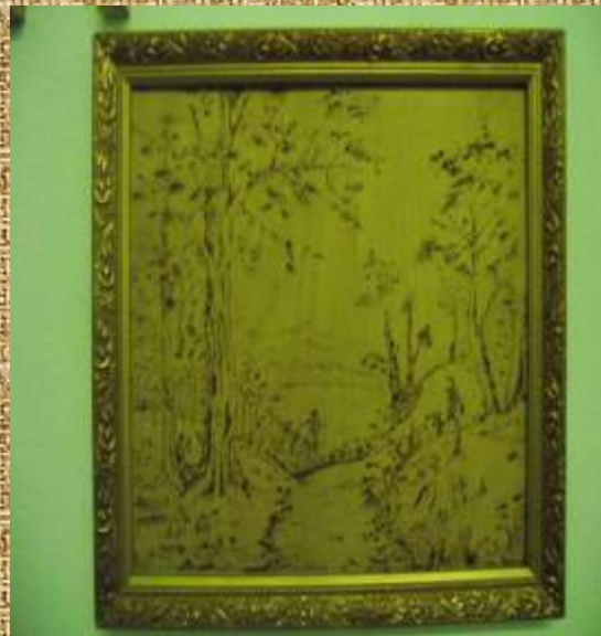
“Пейзаж”. Техніка виконання випалювання по дереву