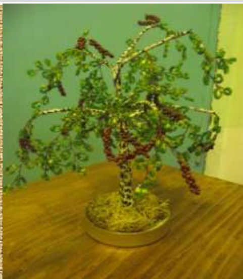
Плетіння з бісеру