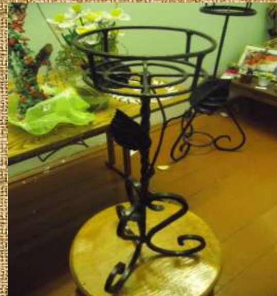
“Підставка під вазон” Техніка виконання гнуття металу.