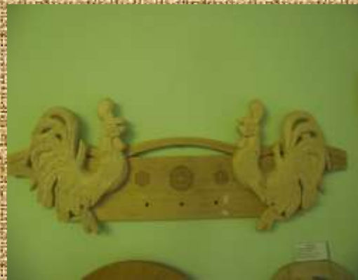
Різьба по дереву