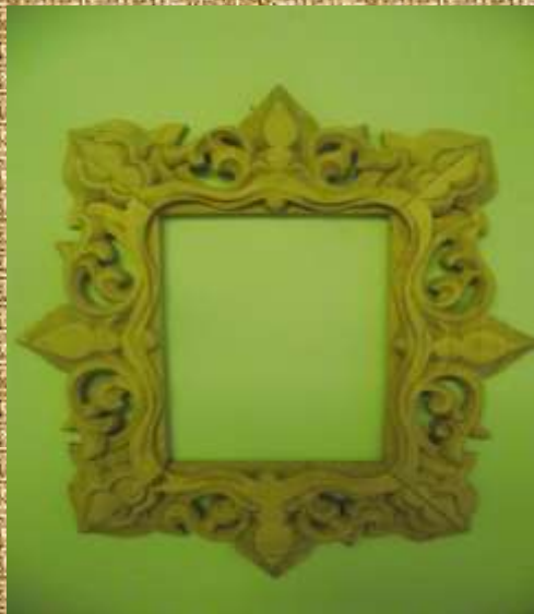
“Рамка церковна”. Техніка виконання об’ємна різьба “