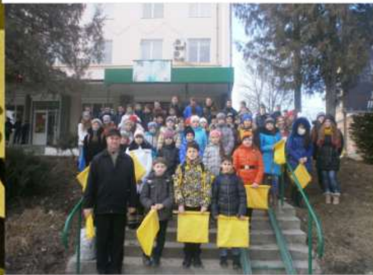
Участь у районних флеш – мобах «За Україну, за її волю», «Пам'яті Небесної Сотні»