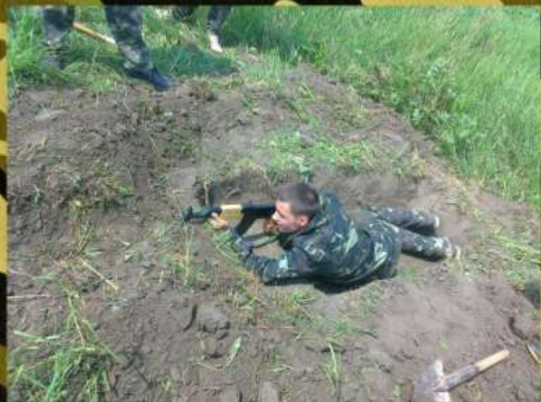
Уроки вогневої підготовки