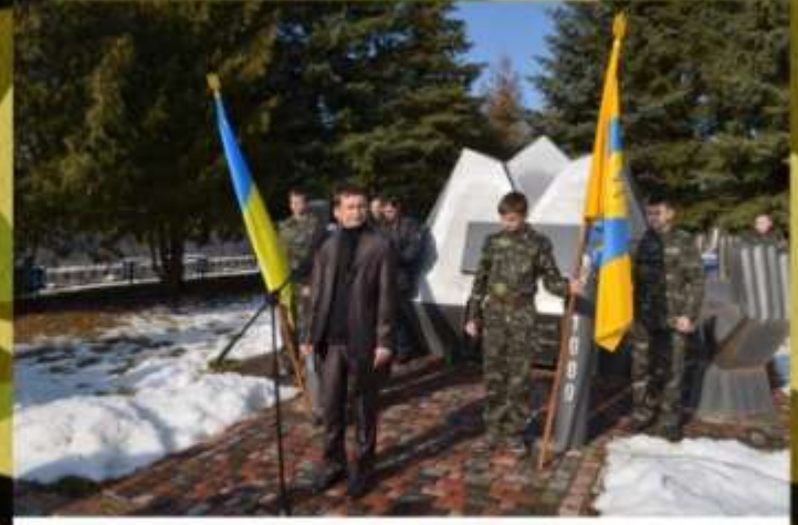
Уроцистості, присвячені 25-річчю виведення військ з Афганістану