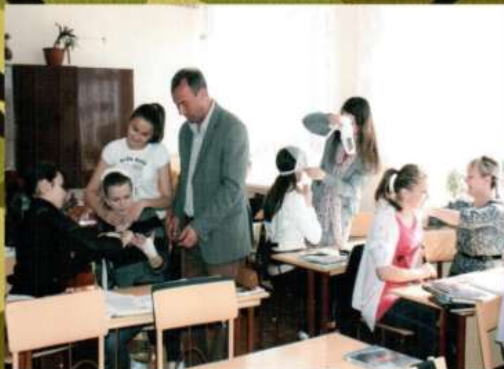
Практичні заняття з учнями 10-11-х класів на уроці з медично-санітарної підготовки