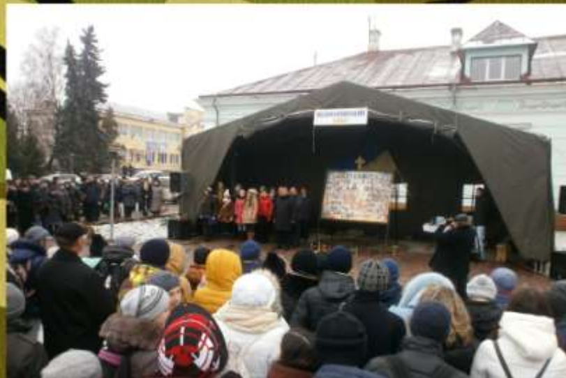
Участь учнів 10-11 класів у поминальному дійстві, приуроченому пам'яті Небесної Сотні