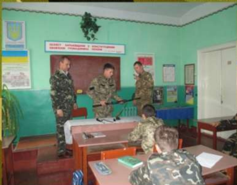
Урок-практикум із вогневої підготовки з учасником АТО