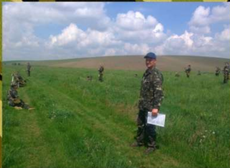
Уроки тактичної підготовки