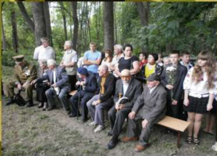
Запрошення ветеранів Підволочиського району на захід, приурочений Дню створення УПА (2014р.)