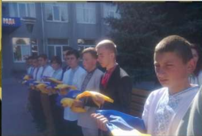
День Прапора, 2015р.