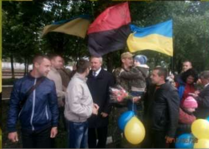
Зустріч бійців АТО на вокзалі селища, 2015р.