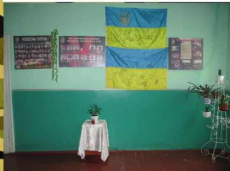
Куток героїзації в кабінеті 3В