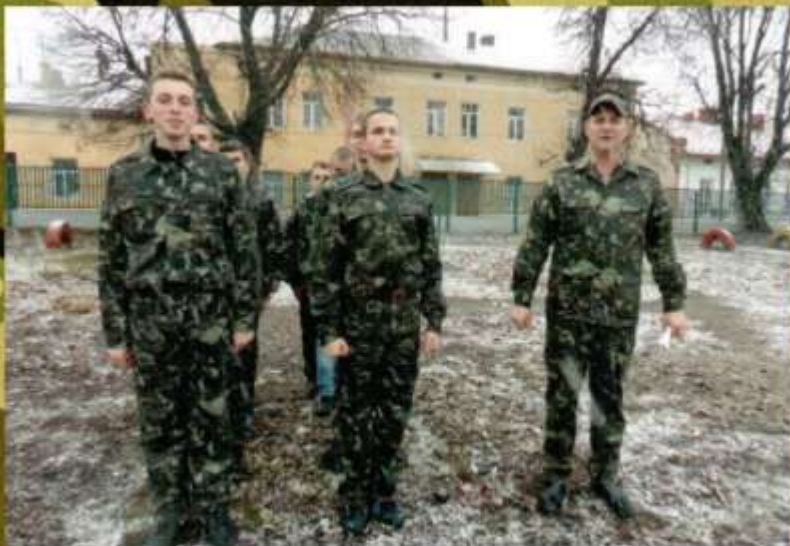
Практичні заняття з учнями 10-11-х класів на уроці з строевої підготовки