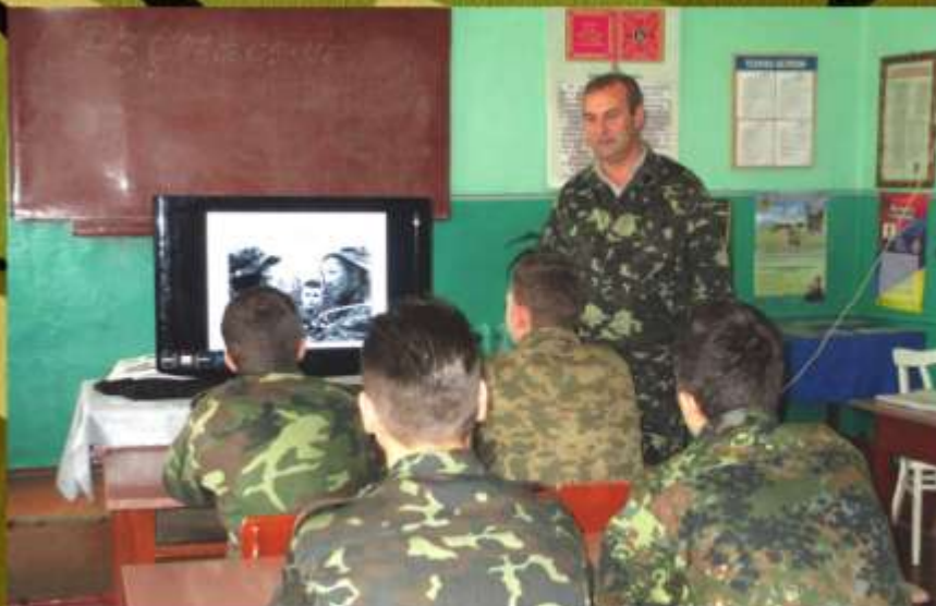
Використання Іноваційно-комунікаційних технологій на уроках «Захисту Вітчизни»