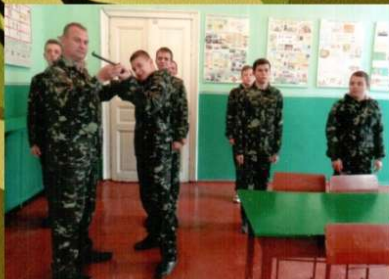
Практичні заняття з учнями 10-11-х класів на уроці з вогневої підготовки