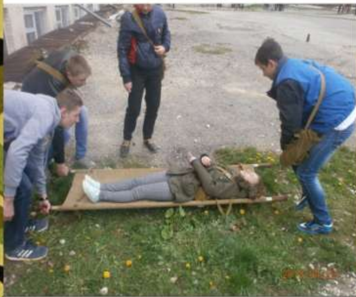
Уроки цивільного захисту