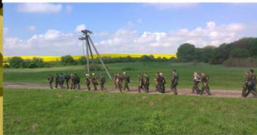
Навчально-польові табірні збори , 2014 р.