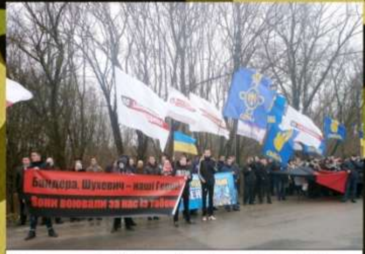
Святкування Дня Соборності та єднання, 22 січня 2015 року